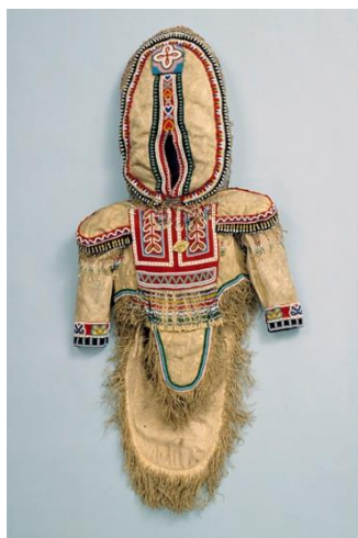
Fig. 12 : Amauti photographié à plat.

Pour évaluer comment cet amauti devait être présenté, nous avons comme référence cette photo d'un groupe de femmes portant ce type de vêtement. L'observation du vêtement, lors du montage préliminaire sur mannequin, nous a permis d'évaluer l'état et la malléabilité de l'ouverture frontale, de la peau et du motif perlé. Dans le but de ne pas créer de tension sur les rebords de l'ouverture frontale, pour bien soutenir le volume du capuchon et parce que la souplesse de la peau le permettait, il a été décidé, qu'en plus d'un délicat support de métal, des formes réalisées à partir de matériaux textiles seraient insérées dans le capuchon pour bien supporter la peau fragile et mettre en valeur la coupe du vêtement.