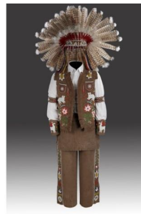
Fig. 29 : Ensemble, Haudenosaunee, composé de plusieurs éléments, chacune de ses composantes ayant nécessité un support particulier.

On constate la grande fragilité des matériaux tel que coquillage, piquants de porc-épic, perles de verre, cheveux, peaux et fourrures traitées avec les méthodes traditionnelles.