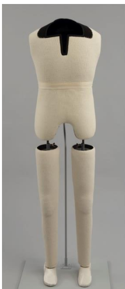
Fig. 36 : Sections rigides du mannequin formant le squelette.