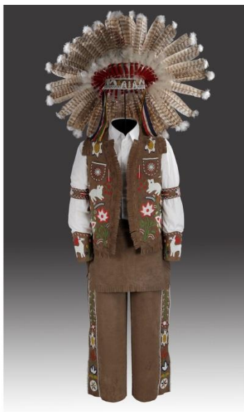
Fig. 5-6 : Ensemble photographié pour l'exposition À la croisée des chemins : Le perlage dans la vie des Iroquois (à gauche) et pour l'exposition Porter son identité : La collection Premiers Peuples (à droite).