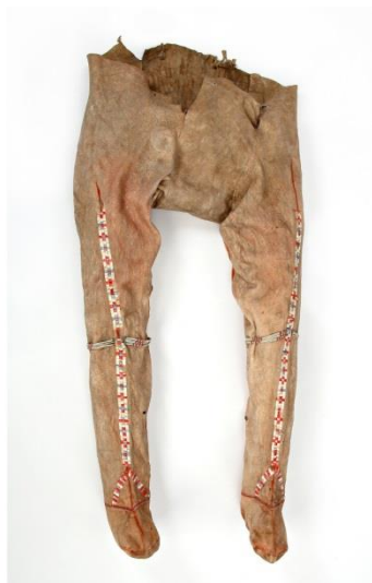
Fig. 35 : Pantalon déné