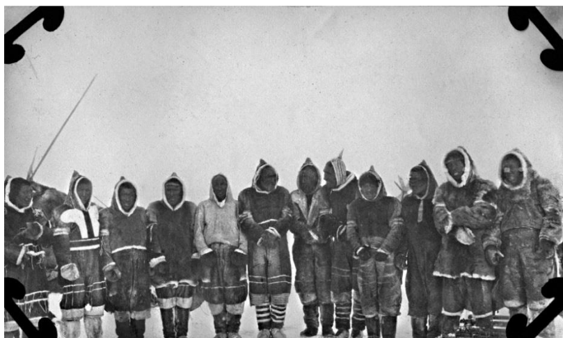
Fig. 1 : Groupe d'hommes inuits à Melville Sound.

Cette photo d'un groupe d'inuits a contribué à une meilleure compréhension des vêtements inuits présentés en exposition. Pour ce parka et ce pantalon, la difficulté d'interprétation venait du modèle de capuchon qui est très petit et peu profond et de la longueur de fourche du pantalon qui excède celle des pantalons standards.