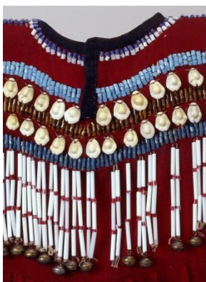
Fig. 30 : Robe (détail): coquillage, perles de verre et clochettes de laiton.

On constate la grande fragilité des matériaux tel que coquillage, piquants de porc-épic, perles de verre, cheveux, peaux et fourrures traitées avec les méthodes traditionnelles.