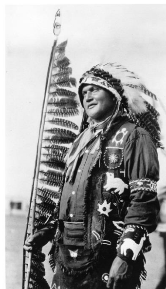
Fig. 7 : Photo d'un homme non identifié, sans doute l'un des acteurs du village de Chief Poking Fire, 1935, portant l'ensemble présenté ici.