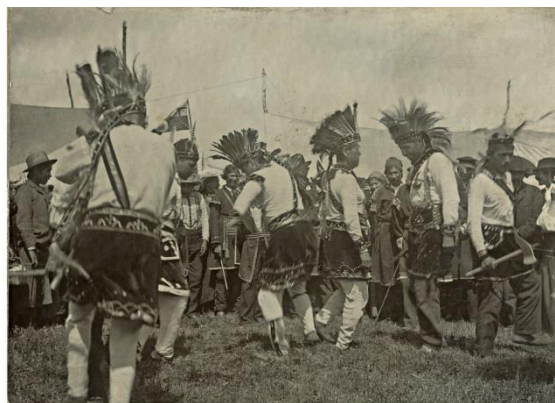
Fig. 4 : Représentation d'une danse mi'kmaq.