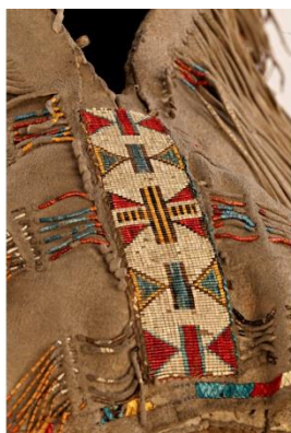
Fig. 31 : Tunique (détail): broderie de piquants de porc-épic.