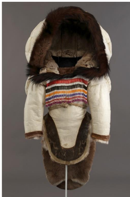
Fig. 19-20 : Amauti avec le capuchon positionné de façon asymétrique, photographié en 1992 (à gauche). Le même amauti avec le capuchon présenté de façon symétrique, supporté adéquatement (à droite).