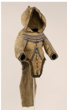
Fig. 26 : Amauti , Inuit, à la coupe particulière : poche au dos, capuchon immense, sans ouverture, fourrure à l'intérieur et qui doit être enfilé.