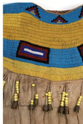
Fig. 32 : Robe (détail): perles de verre et dés à coudre de métal.