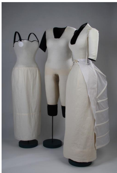
Fig. 25 : Mannequins de buckram de type « invisible ».