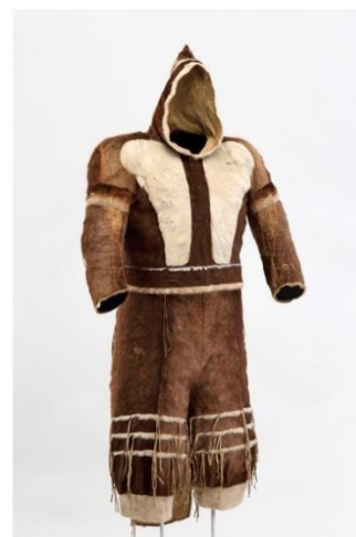
Fig. 2 : Parka et pantalon inuits.