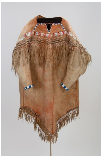
Fig. 34 : Tunique déné.

L'étude de la réalisation d'un mannequin « sectionnable » pour un ensemble d'homme déné du 19e siècle, tunique et pantalon, a contribué à définir ce qu'est un mannequin « sectionnable » et avec quels avantages il se distingue.