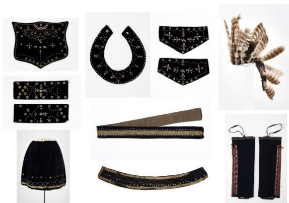
Fig. 3 : Ensemble, mi'kmaq.

Dans le cas de cet ensemble de danse mi'kmaq sélectionné pour une future rotation, il faudra évaluer quels modèles de chemise et de pantalon seront requis pour compléter l'ensemble.