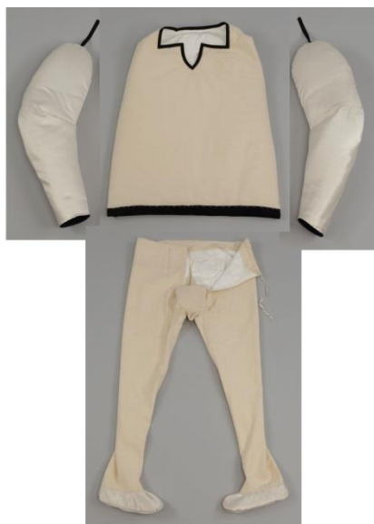
Fig. 37 : Sections flexibles du mannequin conçues à partir des dimensions du vêtement.