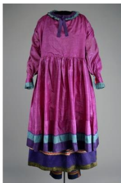
Fig. 9-10 : Ensemble de femme kanien'kehaka, présenté avec ceinture (reproduction) et sans ceinture.