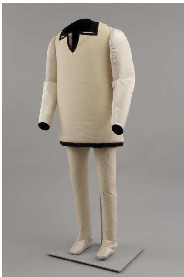
Fig. 38 : Mannequin «sectionnable».