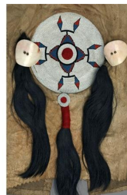
Fig. 33 : Veste (détail): perles de verre, cheveux, boutons de nacre.