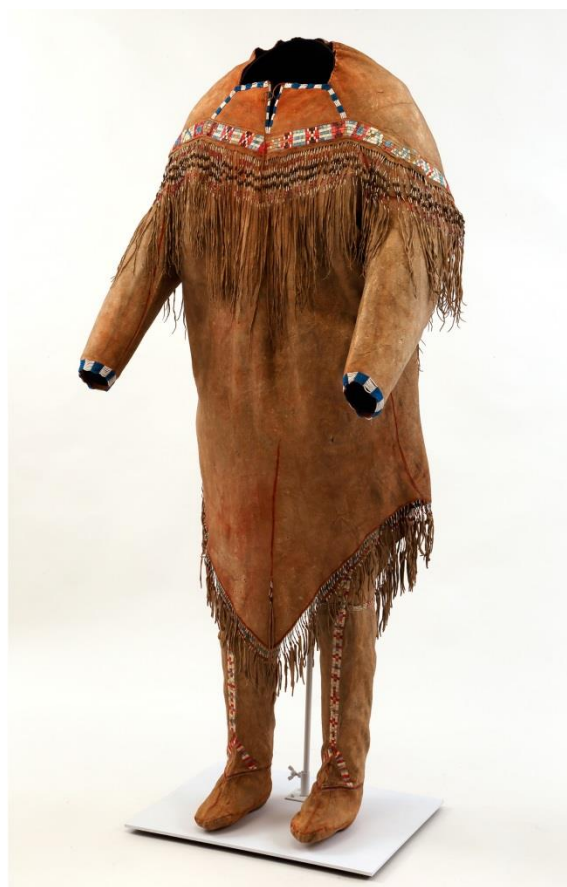
Fig. 39 : Tunique et pantalon dénés sur mannequin.