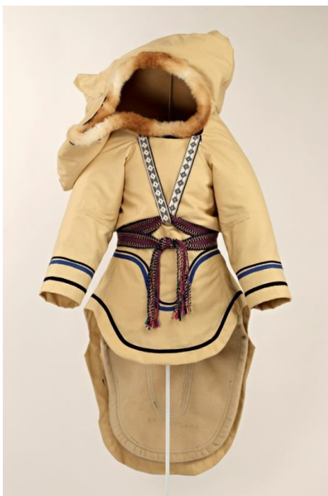
Fig. 21 : Amauti photographié avec le capuchon surélevé.

Parce qu'il était impossible, faute de temps, de mesurer tous les vêtements sélectionnés pour les futures rotations, le scénographe a dû composer avec les dimensions des vêtements de la première rotation pour concevoir le mobilier d'exposition. Dans le cas de cet amauti sélectionné pour la 3e rotation, le vêtement a été présenté le capuchon en position abaissée pour prendre place dans la vitrine dont les dimensions ne permettaient pas qu'il soit présenté le capuchon surélevé. Une photo de l'objet montrant l' amauti le capuchon surélevé a été mise dans la vitrine au côté de l'objet pour le mettre en contexte.