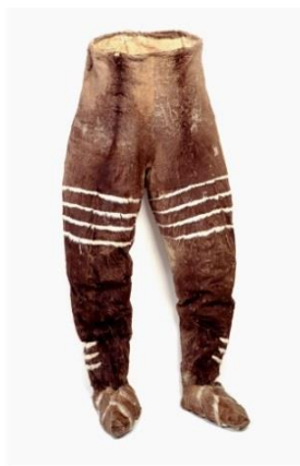
Fig. 28 : Pantalon, Inuit, à la coupe particulière : pantalon-mocassin, sans ouverture à la taille.