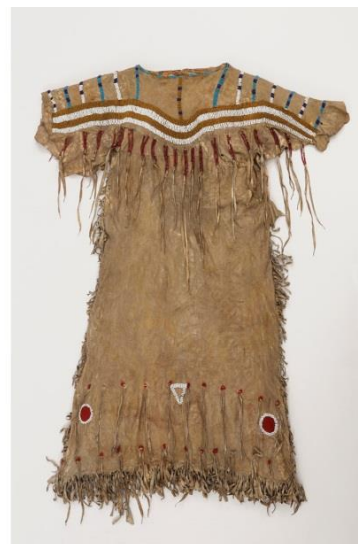
Fig. 16 : Robe de femme, Niitsitapi, peau et perles de verre.