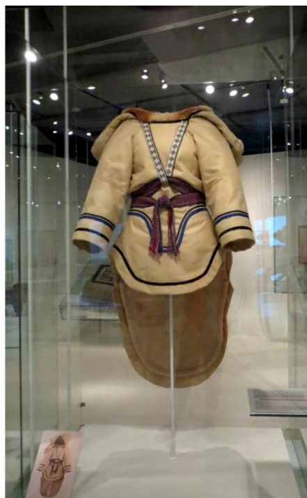
Fig. 22 : Amauti avec le capuchon en position abaissée dans la vitrine.