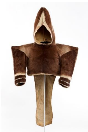
Fig. 27 : Parka, Inuit, à la coupe particulière : avec le capuchon pointu, les épaules larges et de forme carrée.