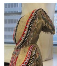
Fig. 14 : Position du capuchon lors d'un montage préliminaire de l' amauti .