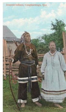
Fig. 11 : Homme et femme portant une robe sans ceinture.