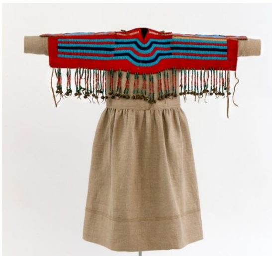
Fig. 24 : Empîecement de robe, Iyarhe Nakoda, sur un mannequin présenté avec une robe reproduction.