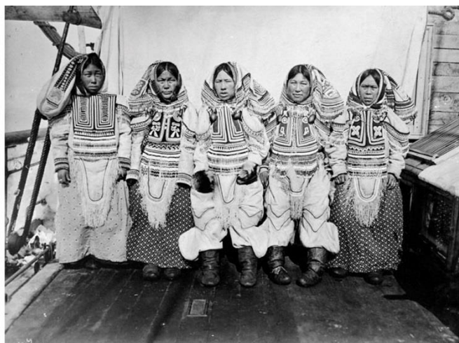
Fig. 13 : Photo d'un groupe de femmes portant l' amauti .