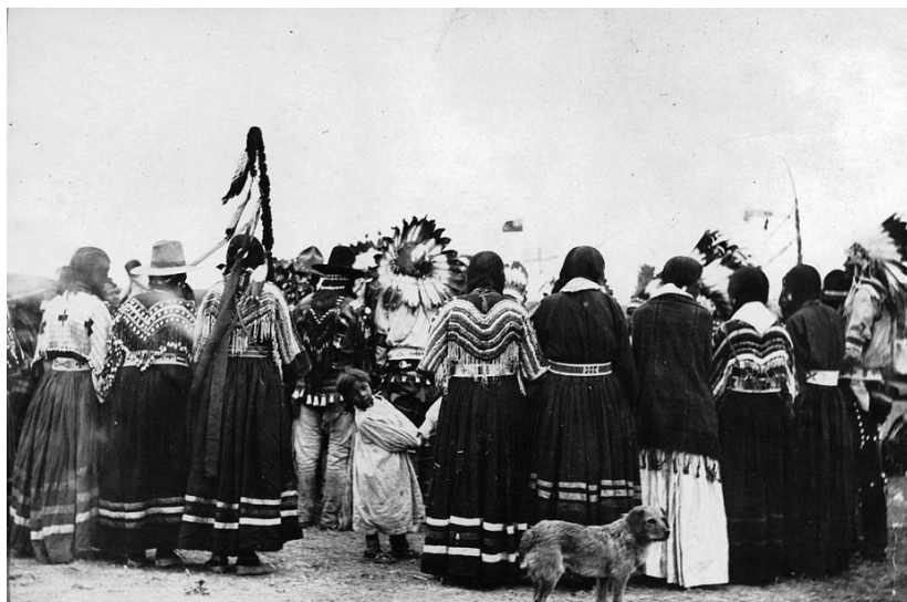
Fig. 15 : Photo d'un groupe de personnes niitsitapi dont une femme portant une robe au motif perlé.

Les deux robes suivantes comportent le même motif perlé sur le haut du corsage. Les matériaux, l'une de laine et l'autre de peau, diffèrent. La structure de la robe de laine est en bonne condition tandis que la structure de la robe de peau est plus fragile. La condition de l'objet permettait que la robe de fille soit présentée sur mannequin, mais les bras devaient être en position horizontale pour ne pas créer de tension dans le motif perlé. Par contre, la robe de femme a été présentée à plat parce que sa condition le requiert, un support rembourré ayant été inséré dans la robe pour la mise en valeur du vêtement.