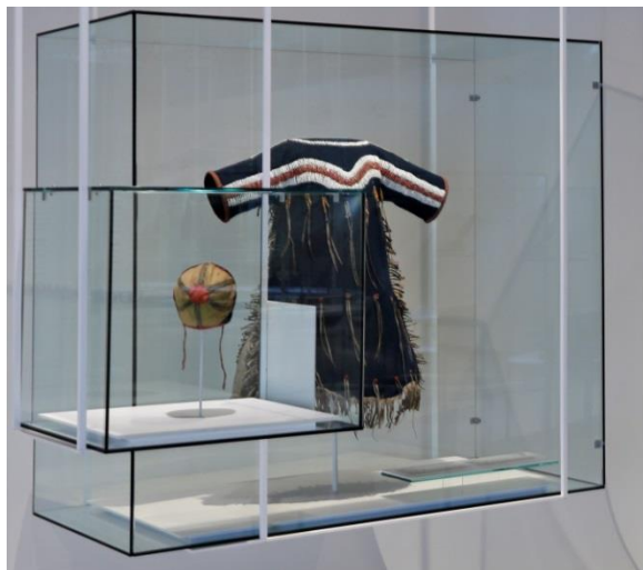
Fig. 23 : Robe, Niitsitapi, dans une vitrine sur mannequin.

Lors de la seconde rotation, un empîecement de robe fut sélectionné en remplacement d'une robe. La forme et les dimensions de la vitrine ayant été conçues pour la présentation d'une robe sur mannequin, il a été décidé de réaliser une robe reproduction en complément de l'empîecement et de les présenter sur mannequin, ceci contribuant à une meilleure compréhension du vêtement et une meilleure utilisation de l'espace disponible dans la vitrine.