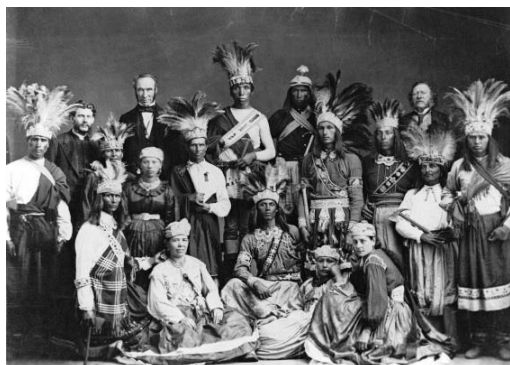
Fig. 8 : Photo de groupe de personnes parmi lesquelles une femme portant une robe avec ceinture.

Pour l'exposition Porter son identité : La collection Premiers Peuples , cet ensemble de femme (robe, jupe et jambières) a été présenté avec une ceinture (reproduction) afin de démontrer l'influence du vêtement européen sur le vêtement traditionnel kanien'kehaka. Dans un autre contexte, cet ensemble pourrait très bien être présenté sans ceinture.