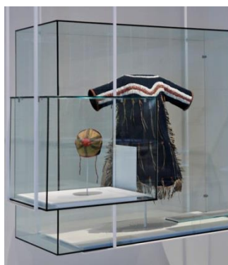
Fig. 17 : Dans une vitrine, sur mannequin : Robe de fille, Niitsitapi, laine et perles de verre.)