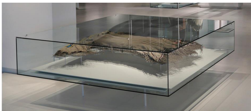
Fig. 18 : Dans une vitrine, présentée à plat sur un support : Robe de femme, Niitsitapi, peau et perles de verre.

L' amauti se distingue par son grand capuchon, amaut , c'est-à-dire la poche dans laquelle la mère dépose son bébé. Pour les besoins de la conservation, le capuchon doit être positionné de façon asymétrique pour évoquer la présence de la tête de la mère et de l'enfant. Pour les besoins de la restauration, le capuchon d'un des amautis a dû être présenté de façon symétrique et supporté adéquatement par un plateau, pour ne pas créer de tension sur le dessus du capuchon fragilisé par une déchirure.